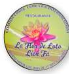
Restaurante La Flor de Loto