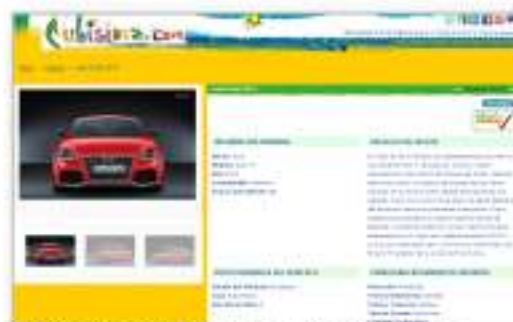
Descripción detallada de los carros ESPECIALES