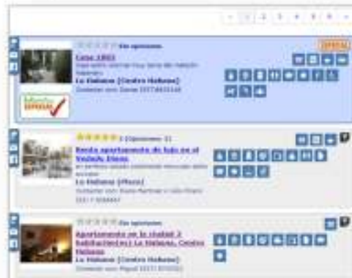
Posición destacada en los resultados de búsqueda