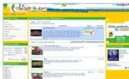
Posición destacada en los resultados de búsqueda