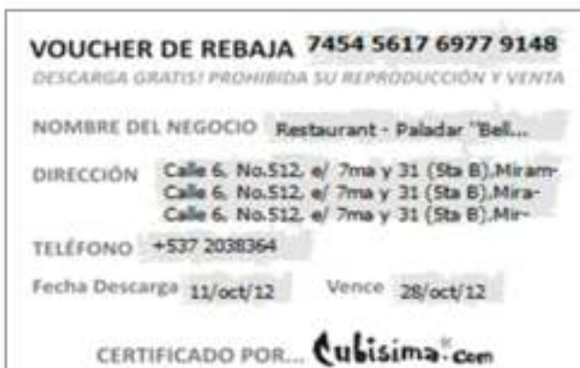
Cupón de rebaja

* Los usuarios solo tendrán acceso a los cupones de rebajas desde Cubisima.com donde podrán descargarlos e imprimirlos. Cada cupón descargado tendrá un número de serie. Cubisima le entregará al dueño del negocio una lista con los números de serie de los cupones y por cada cupón descargado se le enviará un sms con el número de serie correspondiente.