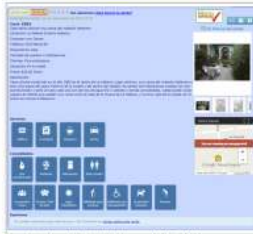
Descripción detallada de la renta ESPECIAL