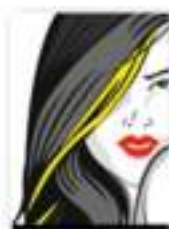
Salón de Belleza DonnaHavana