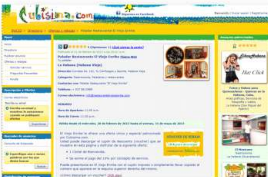
Ejemplo de negocio con cupones de rebajas